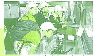
▲ネイチャーセンター